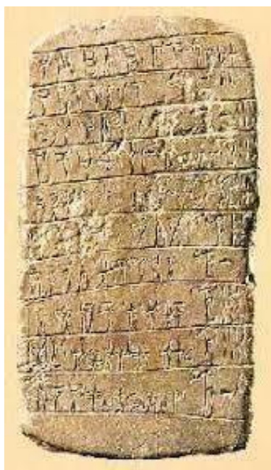
Tabliczka gliniana zapisana pismem linearnym B z Pałacu w Pylos (Grecja) z ok XII w. p.n.e. Znaleziona kierując się opisami Homera.

Najsłynniejszą biblioteką starożytności jest Biblioteka Aleksandryjska w Egipcie. Powstała z inicjatywy Ptolemeusza I Sotera i funkcjonowała od II w. p.n.e. do IV w. n.e. przy Muzeum Aleksandryjskim. Biblioteka była podzielona na dwie części. Jedna część mieściła główny zbiór, znajdowała się na terenie pałacu królewskiego i była dostępna tylko dla nielicznych. Druga część biblioteki była dostępna publicznie i znajdowała się w tzw. Sarapejonie, czyli w świątyni Serapis. Ważną postacią z dziejów Biblioteki Aleksandryjskiej w Egipcie był Zenodot z Efezu - grecki uczyony, żyjący na przełomie IV i III w. p.n.e. Został on mianowany pierwszym kustoszem biblioteki. Za czasów Zenodota podejmowano prace nad katalogowaniem zbiorów. Biblioteka została częściowo zniszczona w 47 r. p.n.e. przez Juliusza Cezara, a ostatecznego zniszczenia dokonał Teodozjusz I w IV w. n.e.