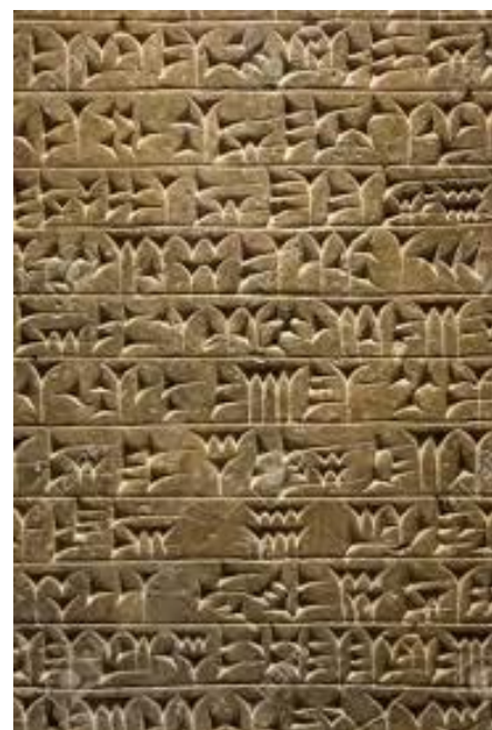
Tabliczka gliniana zapisana pismem klinowym z Archiwum Assurbanipala w Ninwie z ok 700 r. p.n.e.

Biblioteki w średniowieczu zaczęły powstawać mniej więcej w V i VI w., miały charakter prywatny i posiadały ściśle określony krąg użytkowników. Funkcjonowały zazwyczaj przy klasztorach. Główny impuls dla gromadzenia ksiąg w wiekach średnich dał król Ostrogotów Teodoryk Wielki, który skupił się na literaturze antycznej jednocześnie wspierając pisarzy i wydawców.