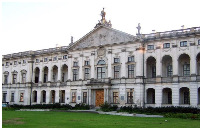
Pałac Kraszińskich w Warszawie – poprzednia siedziba Biblioteki Narodowej

W XIX wieku i na początku XX wraz z upowszechnieniem się nauki, biblioteki uzyskały rangę instytucji społeczno-kulturalnych o charakterze publicznym. Biblioteki i ich funkcje stawały się coraz bardziej zróżnicowane. Gwałtowny rozwój nauki, techniki, szkolnictwa, wzrost produkcji wydawniczej – to wszystko spowodowało intensywny rozwój bibliotek i usług bibliotecznych. Wzrósł stan zbiorów i ich wykorzystanie. Działalność bibliotek w zakresie udostępniania